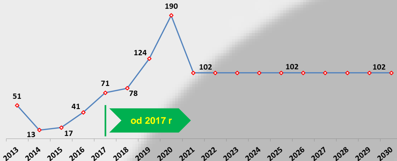
Liczba uprawnień do emisji przeznaczonych na AUKCJE przez Polskę do 2030 r mln. EUA/rok.

Z uwagi na zakłócenia, jakie zróżnicowane w różnych krajach koszty emisji pośrednich, przenoszone w ceny energii elektrycznej „czarnej”, powodują na wspólnym rynku UE, niezbędne jest wprowadzenie harmonizacji przepisów dotyczących wprowadzania Systemów Rekompensat Finansowych na poziomie KE: